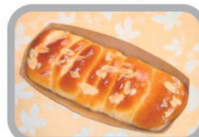
◇アップルカスタード 330円