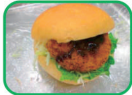
◇メンチカツバーガー 220円