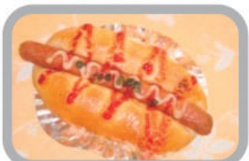
◇バリバリウインナー 160円