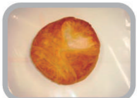
◇クイニーアマン 170円