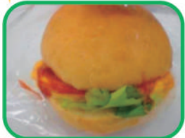
◇オムレツバーガー 220円