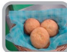
◇塩バターメロンパン 170円