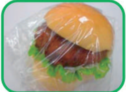
◇ハムカツバーガー 220円