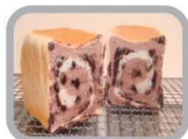
◇うずまきチョコ 330円