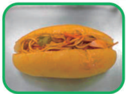
◇ナポリタンパン 200円