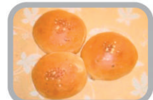
◇チーズパンズ (5個) 270円