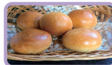
◇塩パン (1個) 110円