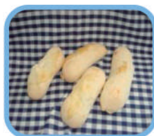
◇チーズスティック 170円