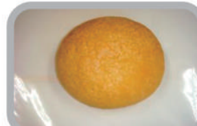
◇クリームチーズメロン 150円